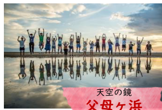
天空の鏡 父母ヶ浜

※高屋神社へは途中、【高屋神社シャトルバス】(運行：三豊中央観光バス・河田タクシー・西讃観光・秋交通サービス)へ乗り換えます。