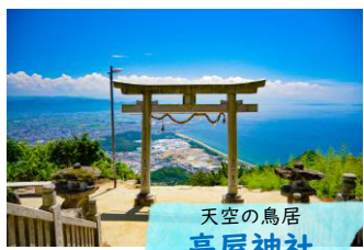
天空の鳥居 高屋神社

日本の「ウユニ塩湖」とも呼ばれ、美しい水鏡が見られると人気のスポット。山からの空気と海からの空気の温度が一定になった「瀬戸の夕風」の時には水面にきれいに反射されます。